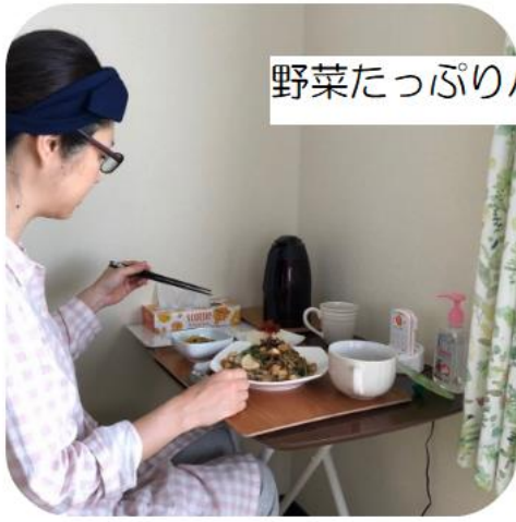
野菜たっぷりバランスのとれた食事