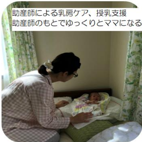
助産師による乳房ケア、授乳支援 助産師のもとでゆっくりとママになる練習をしていきます